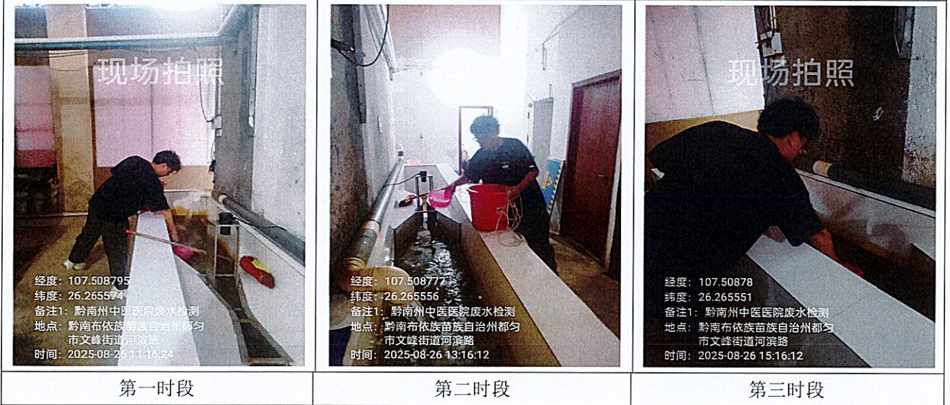
综合排污口 现场采样照片